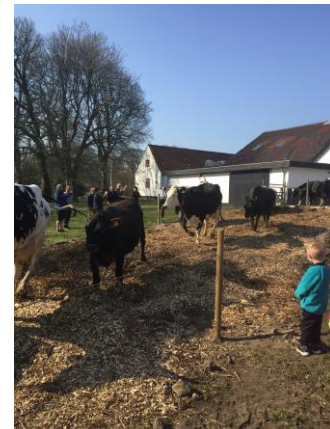
Vi er på Møltrup for at se kørne danse