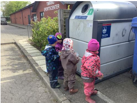
Vi har fokus på affaldssortering

Hverdagen hos os veksler mellem aktiviteter og leg i det store og i et mindre fællesskab. I de mindre grupper kan børnene fx være aldersopdelt, da det giver mulighed for at planlægge de pædagogiske aktiviteter mere målrettet. I de mindre grupper er man sammen med en voksen som har et højt fokus på et nuanceret og alderssvarende sprog, som understøttes af aktiviteter som vi i periodens tema arbejder med.